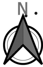
Схема транспортної мобільності та інфраструктури М 1:1000